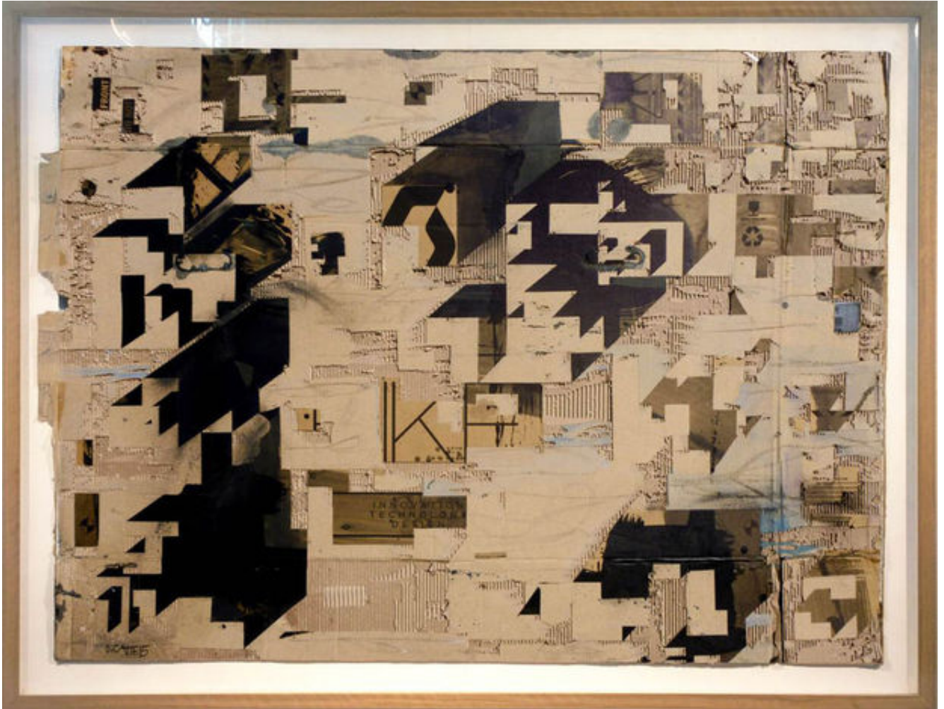
Oeuvres récentes © Olivier Catté

Véritable orfèvre du rebut, le Français Olivier Catté pose ses balises en carton à la galerie Lazarew. Au programme, la ville et bien plus.